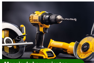
Manejo de herramientas.