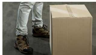
Levantamiento de objetos