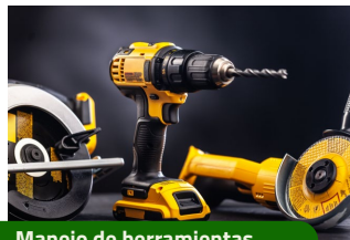
Manejo de herramientas.