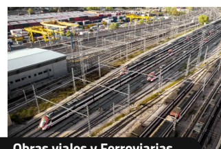
Obras viales y Ferroviarias.