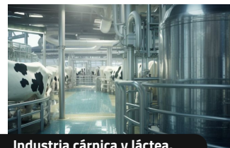
Industria cárnica y láctea.