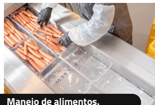
Manejo de alimentos.