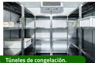
Túneles de congelación.