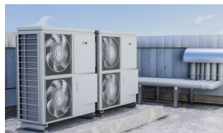
Trabajos en exterior.