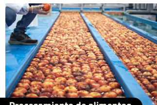
Procesamiento de alimentos.