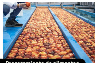
Procesamiento de alimentos.