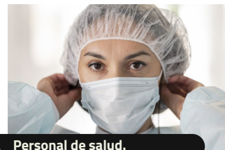
Personal de salud.