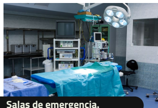
Salas de emergencia.