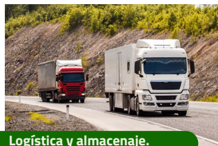
Logística y almacenaje.