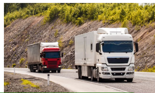
Logística y almacenaje.