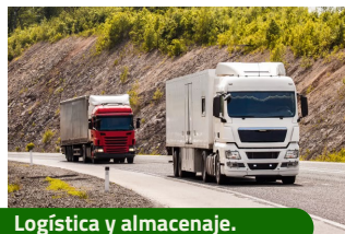
Logística y almacenaje.