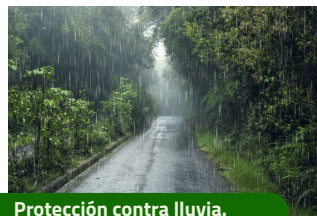
Protección contra lluvia.