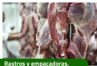
Rastros y empacadoras.