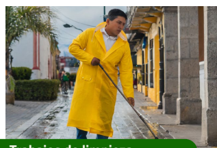
Trabajos de limpieza.