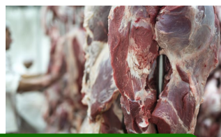
Rastros y empacadoras.