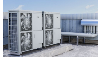
Trabajos en exterior.