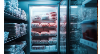
Almacenes de congelación.