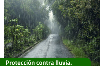
Protección contra lluvia.