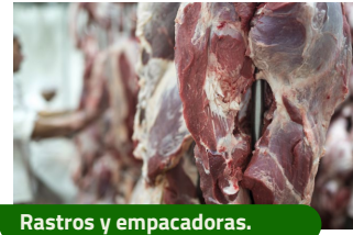
Rastros y empacadoras.