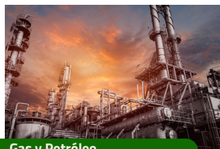
Gas y Petróleo.