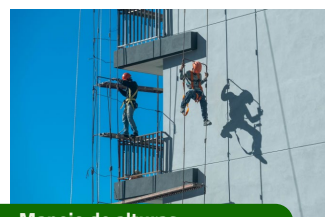
Manejo de alturas.