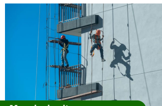
Manejo de alturas.