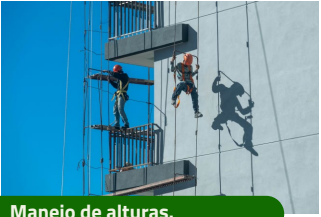
Manejo de alturas.