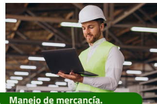
Manejo de mercancía.