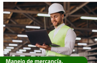
Manejo de mercancía.