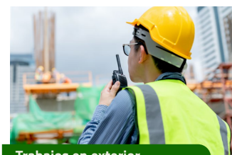
Trabajos en exterior.