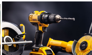
Manejo de herramientas.