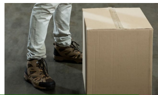
Levantamiento de objetos