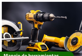
Manejo de herramientas.