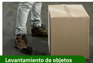
Levantamiento de objetos