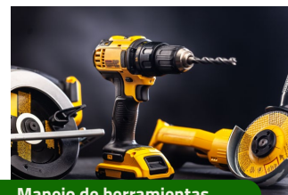
Manejo de herramientas.