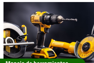
Manejo de herramientas.