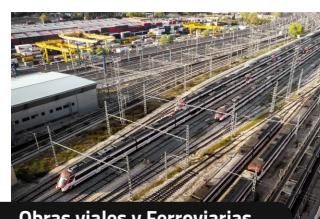
Obras viales y Ferroviarias.