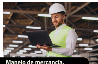
Manejo de mercancía.