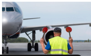
Transporte terrestre y aéreo.