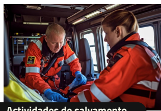
Actividades de salvamento.