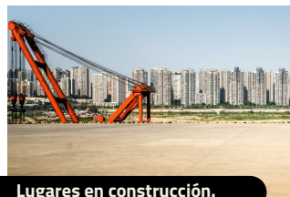
Lugares en construcción.