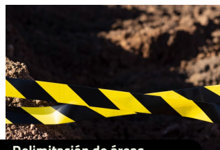
Delimitación de áreas.