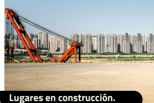
Lugares en construcción.