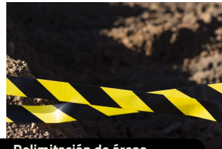
Delimitación de áreas.