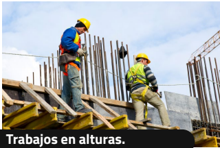
Trabajos en alturas.