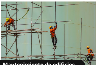
Mantenimiento de edificios.