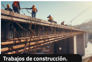
Trabajos de construcción.