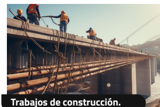
Trabajos de construcción.