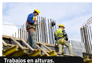
Trabajos en alturas.