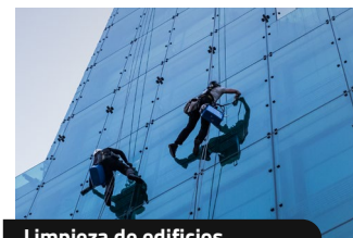
Limpieza de edificios.