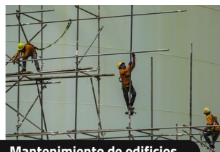
Mantenimiento de edificios.